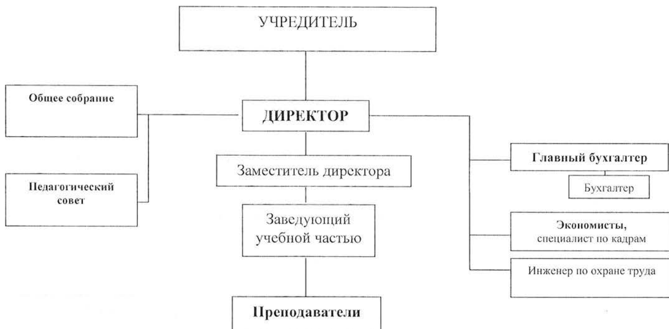
Рис. 1 Организационная структура ЧОУ ДПО «УАЦТД»